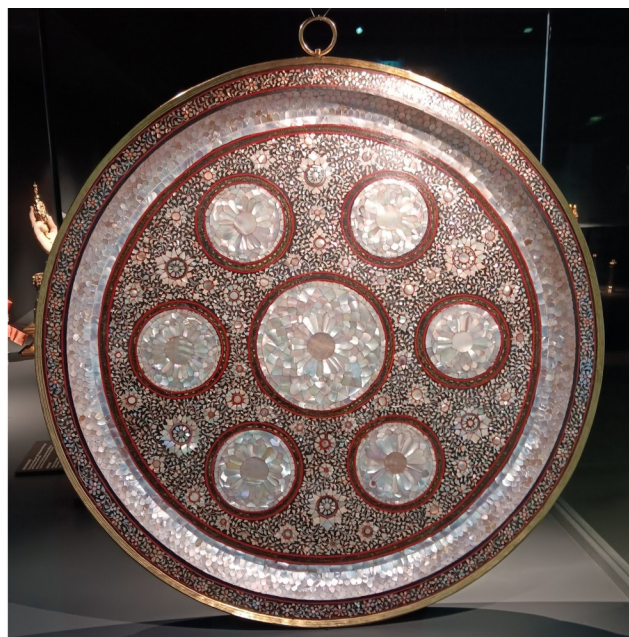
Liturgický kalich a perletí intarzovaný táč.

Kromě Korunovačního kříže jsou na výstavě i další unikátní exponáty intimně propojené s naší historií a státností. Mám na mysli předměty svázané s osobou Svatého Václava – patrona České země. Je tu jeho železná přilbice, kroužková košile i pohár. Všechny tyto objekty k nám jasně promlouvají přes tisíciletou propast.