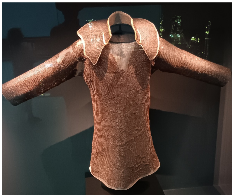
Kroužková košile Svatého Václava – patrona České země (10. století)

Kromě Korunovačního kříže jsou na výstavě i další unikátní exponáty intimně propojené s naší historií a státností. Mám na mysli předměty svázané s osobou Svatého Václava – patrona České země. Je tu jeho železná přilbice, kroužková košile i pohár. Všechny tyto objekty k nám jasně promlouvají přes tisíciletou propast.