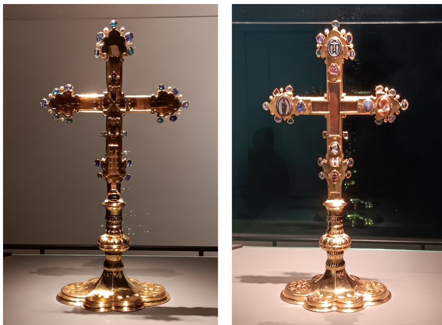
Korunovační kříž nebo také Zemský kříž Českého království z přední a zadní strany.

křišťál a cedrové dřevo. Kříž patří bezesporu k nejvýznamnějším symbolům českého národa a jeho cena je pro Čechy nevyčísitelná.